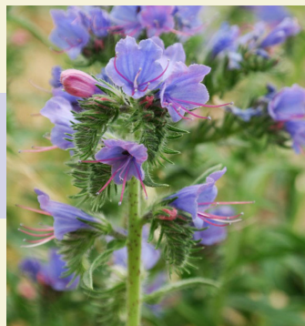
Vipérine utilisée sans doute comme médicament vers 6000 avant J-C en Lybie