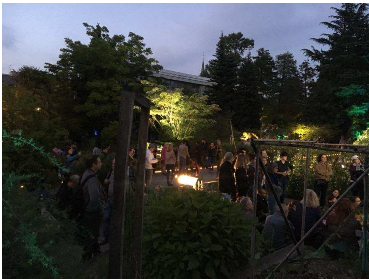
Photo 3 les Strasbourgeois au Jardin Botanique pendant la nuit des musées