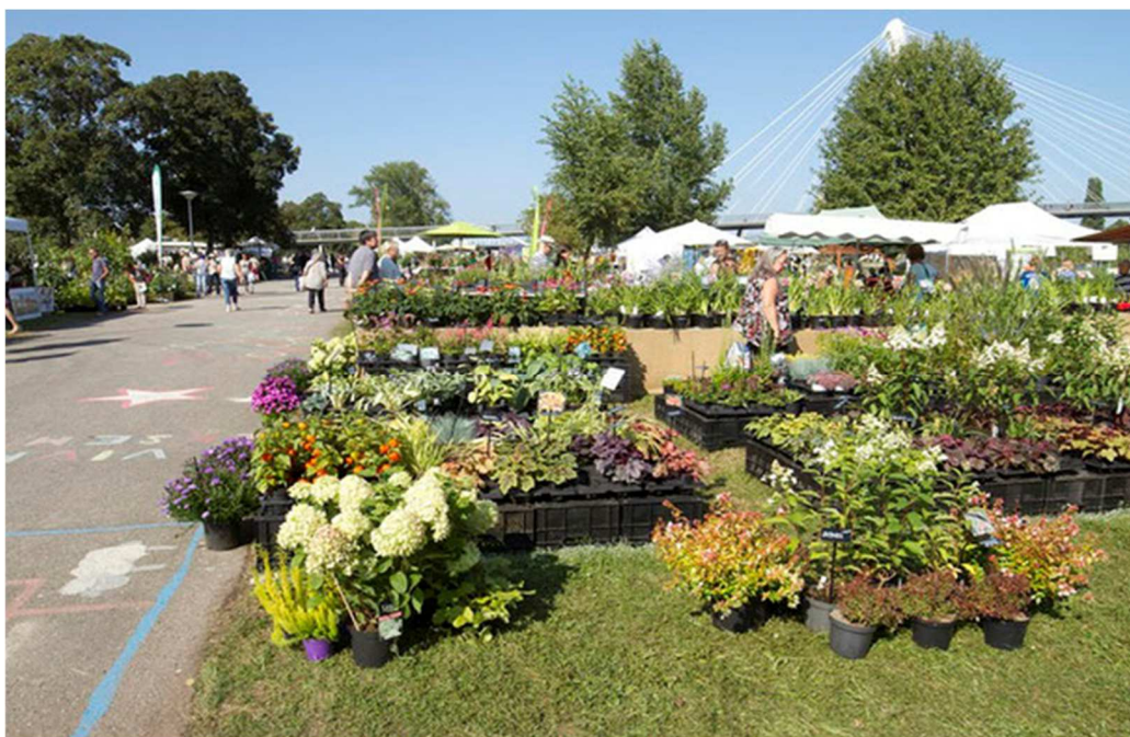
Photo 2 l'édition 2018 de la Fête des Plantes au Jardin des deux Rives

https://www.association-des-amis-du-jardin-botanique-de-strasbourg.fr